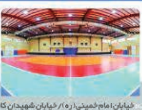
خیابان امام خمینی (ره) / خیابان شهیدان کاظمی