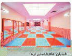
خیابان امام خمینی (ره)