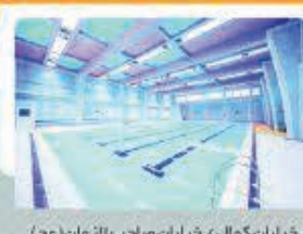
خیابان گمال / خیابان صاحب الزمان (عج)