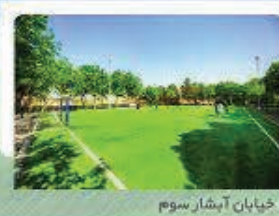
خیابان آبخار سوم