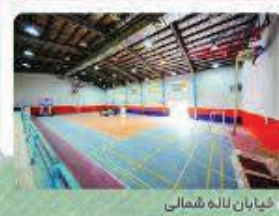
خیابان لاله شمالی