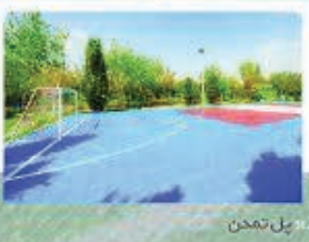
خیابان جل نمخن