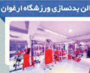
خیابان چهران / خیابان آمل محمد (ص)