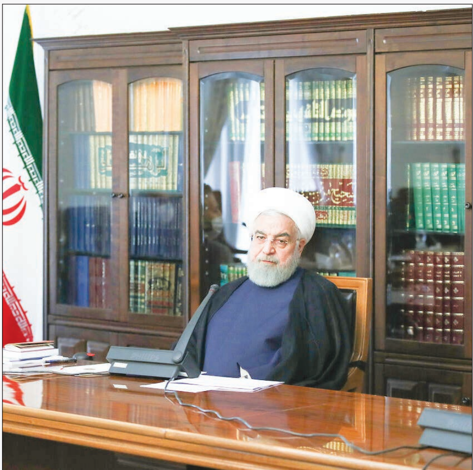
سید علی خامنه‌ای

آیا اعتبارنامه‌های ارجاع شده به شعبه ۱۰ به رأی مجلس گذاشته می‌شود؟