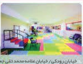
خیابان رودکی / خیابان علان محمد تقی خضری