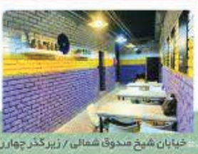
خیابان شیخ صدوق شمالی / زیرگذر چهارراه وکنا