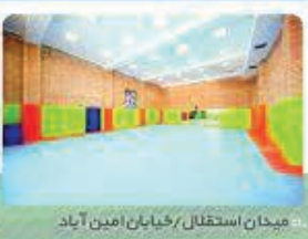
میدان استقلال / خیابان امین آباد