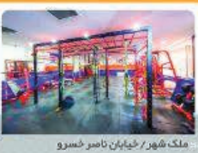
ملک شهر / خیابان ناصر خسرو