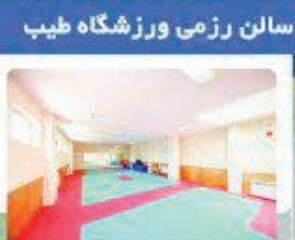
خیابان امام خمینی (ره) / خیابان درخشان