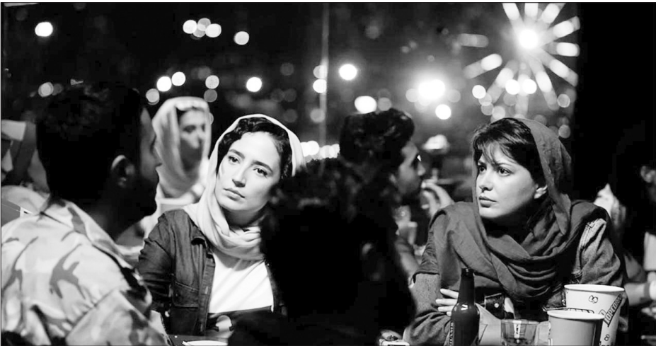
عکس سینمایی زنان