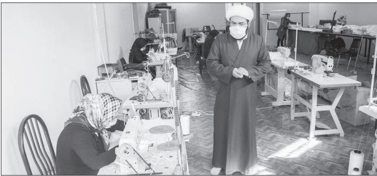
موضوعی که باید جدی گرفت

در این کارگاه تولیدی که در گوشه‌ای از حیاط بزرگ مسجد امام حسین (ع) واقع در شهر جدید سهند قرار دارد، تعدادی از بانوان محله در کنار روحانی مسجد آستین همت را بالا زده و ۱۵۰۰ ماسک به طور روزانه تولید و بین اقشار نیازمند و بیمارستان‌ها به صورت رایگان توزیع می‌کنند.