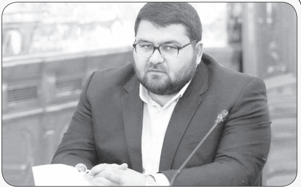
دریافایی / گروه جامعه

وزیر آموزش و پرورش در رابطه با تعطیلی مدارس یادآور شد: معلمان در صورت تعطیلی مدارس ملزم به آموزش در فضای مجازی می‌شوند. وی ادامه داد: ما باید از تبدیل تهدید موجود برای توسعه آموزش‌های مجازی به فرصت بهره‌مند شویم. به نحوی که از این به بعد مدرسه عملاً تعطیل نمی‌شود؛ بلکه