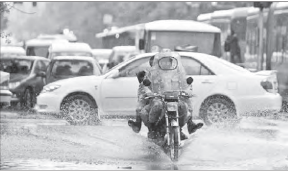
فlooded street in Tehran

دچار مشکل شود. سبیل در شهرها هیچ وقت به خاطر پر شدن نهرها و شبکه‌های فرعی رخ نمی‌دهد. باید یک مسیل یا کانال دچار مشکل جدی شود تا سبیل رخ بدهد که خوشبختانه از این بابت هیچ نگرانی وجود ندارد و سبل تهران را تهدید نمی‌کند. ممکن است در اثر بارش، یک نهر ۴۰ سانتی‌متر پر شود و آب آن داخل خیابان بیاید اما با این همه جای خالی یک پرشش وجود دارد که اگر آسمان بخواهد به همین شکل ببارد یا باز هم باید نگران وقوع انجام دهیم تا در برابر افزایش دما و اقلیم آینده غافل گیر نشویم.