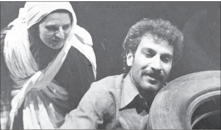
اصغر فرهادی و پر یسا بخت‌آور در سال ۷۳ حین بازی در نمایش «ماشین نشین‌ها» در جشنواره تئاتر داش جویان

ایسنا: مدیر گروه فیلم و سریال شبکه پنج سیما، از پخش سریال‌های تولیدی این شبکه از نوروز ۹۹ خبر داد و در این راستا به سریالی طنز با نام «آخرین نشان مردی» اشاره کرد. وی تأکید کرد: تبدیل رویه پذیرندگی طرح به سفارش‌دهی آن و تغییر رویه محتوایی از پرداخت صرف به آسیب‌ها و سبایه‌های موجود به ترویج نگاه تمدنی به کشور و انقلاب اسلامی، بخشی از این سیاست است. رضوانی یادآور شد: توجه به برندهای موفق شبکه در گذشته، تعریف تولیدات صنعتی و ارزان وزودبازده برای امکان واکنش سریع به موضوعات روز کشور و فراهم آوردن امکان ورود نیروهای جوان و خلاق به بدنه‌نویسندگان و تولیدکنندگان که از مسیر تعریف همان تولیدات خواهد بود از تکالیف ما در شبکه است که با مساعدت مدیران سازمان در حال پیشبرد آن هستیم.