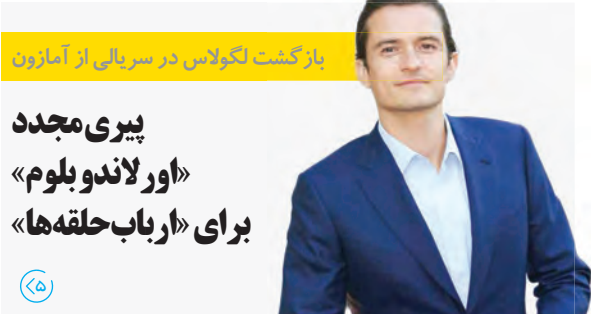
بازگشت لگولاس در سریالی از آمازون