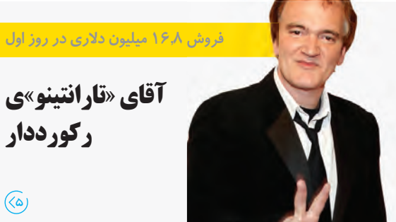
فروش ۱۶۸ میلیون دلاری در روز اول