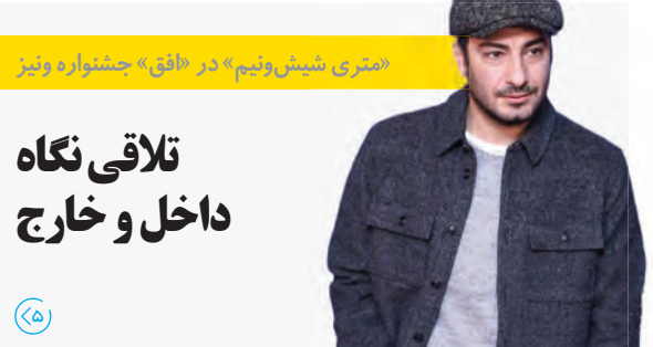
«متری شیش‌ونیم» در «فان» جشنواره ونیز