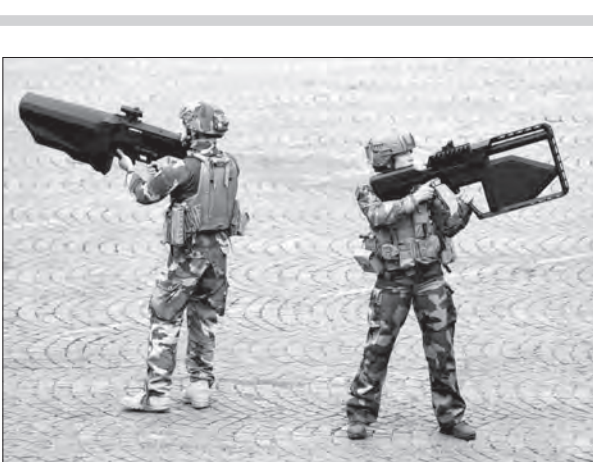
دو نظامی ارتش فرانسه با اسلحه‌ای عجیب